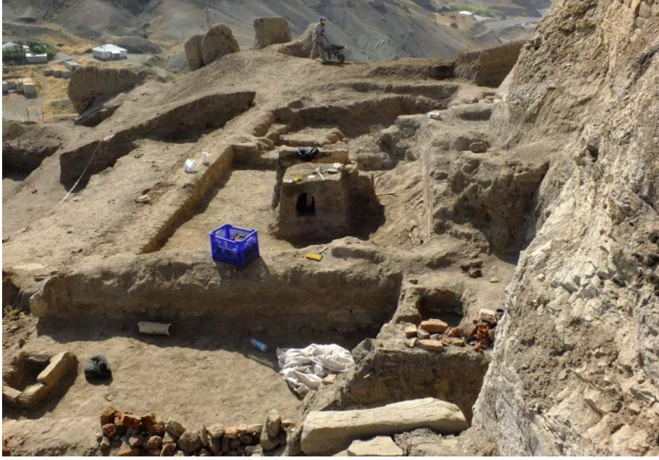
Foto. 13: Hoşap Kalesi Kazısı, II. Alandaki AL-AK -AM, 31 ve AK -30 Plan Karesi Kazı Sonrası Batıdan Görünümü.