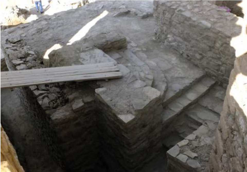
Foto. 12: Hoşap Kalesi Kazısı, II. Alandaki AJ-28/29 Plan Karesi Restorasyon Sonrası.