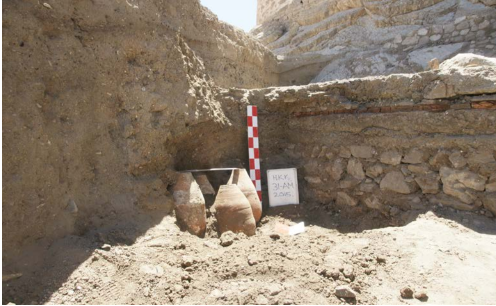
Foto. 16: Hoşap Kalesi Kazısı, II. Alandaki AL-AK -AM, 31 ve AK -30 Plan Karesi Kazı Alanı İnsutu Halde Otlu Peynir Küpleri.