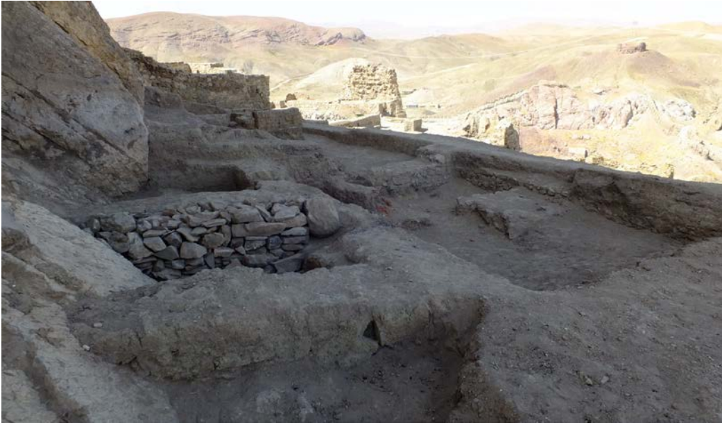
Foto. 14: Hoşap Kalesi Kazısı, II. Alandaki AL-AK -AM, 31 ve AK -30 Plan Karesi Kazı Sonrası Güneydoğudan Görünümü.