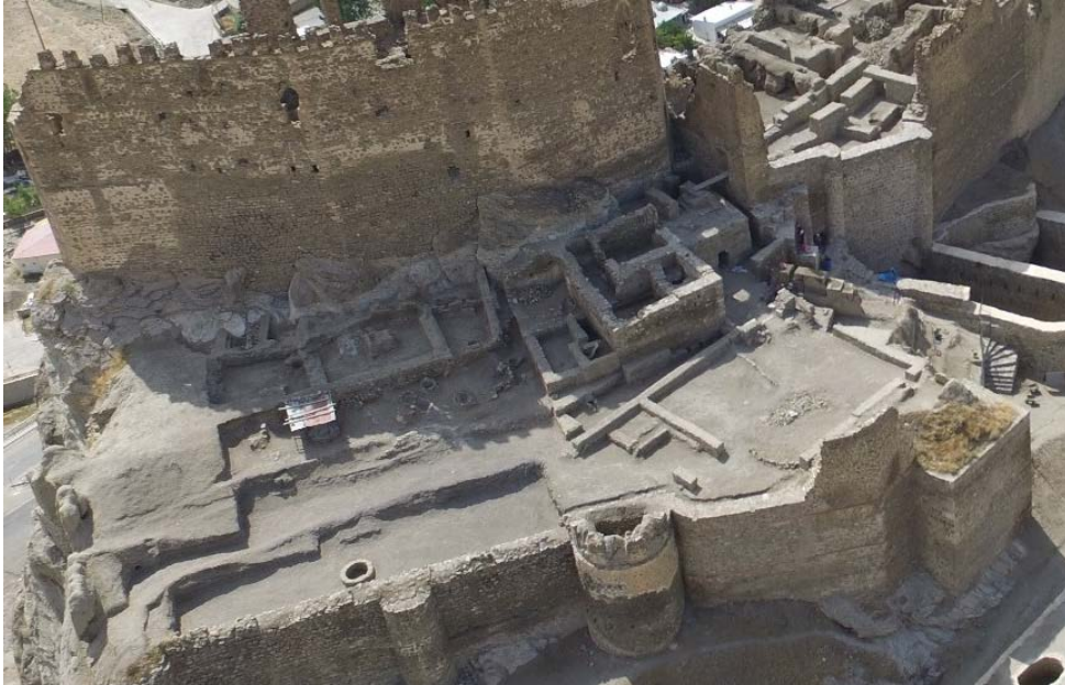
Foto. 10: Hoşap Kalesi Kazısı, II. Alandaki Kazı Çalışmaları Sonrası Havadan Görünümü.