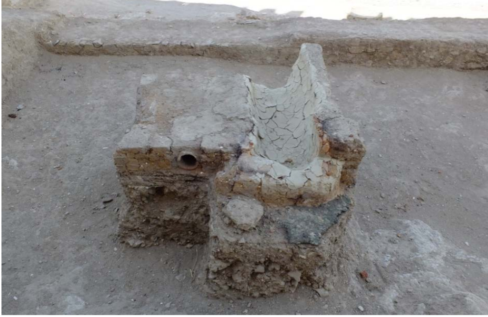
Foto. 15: Hoşap Kalesi Kazısı, II. Alandaki AL-AK -AM, 31 ve AK -30 Plan Karesi Kazı Alanı Fırın Yapısı.