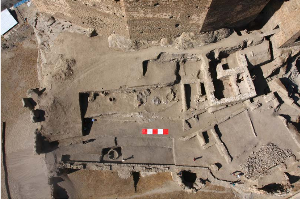
Foto. 9: Hoşap Kalesi Kazısı, II. Alandaki Kazı Çalışmalarından Önce.