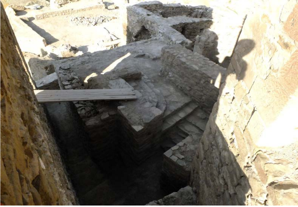
Foto. 11: Hoşap Kalesi Kazısı, II. Alandaki AJ-28/29 Plan Karesi Kazı Sonrası.