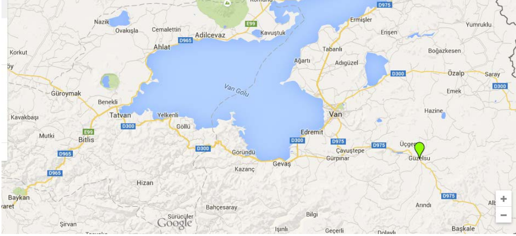
Harita 1: Van Gölü Havzası ve Hoşap Kalesinin Yeri.