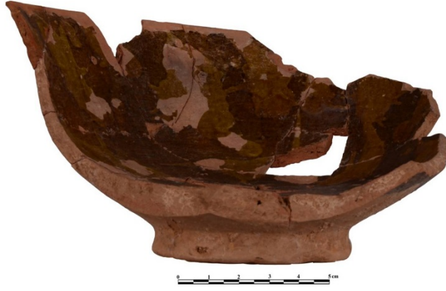
Foto. 17: 2015 Yılı Parçaları Birleştirilen Seramik Kaplardan Bir Örnek