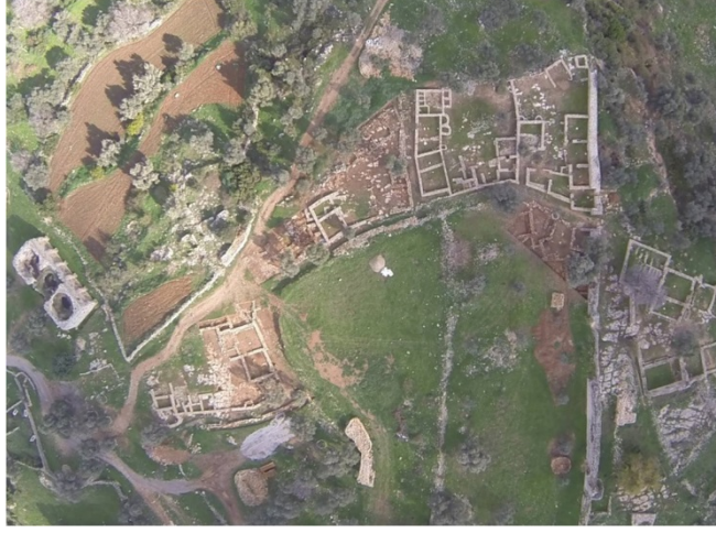
Foto. 14: 2015 Yılında Yapılan Kazılar Sonucunda Çekilen Hava Resmi