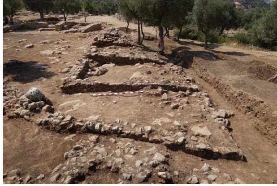
Foto. 11: 2 Nolu Yapıda, Avlunun Kuzeydoğusunda Yer Alan Üçlü Mekân