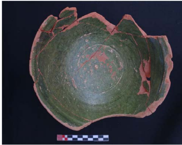
Foto. 16: 2014 Yılı Parçaları Birleştirilen Seramik Kaplardan Bir Örnek