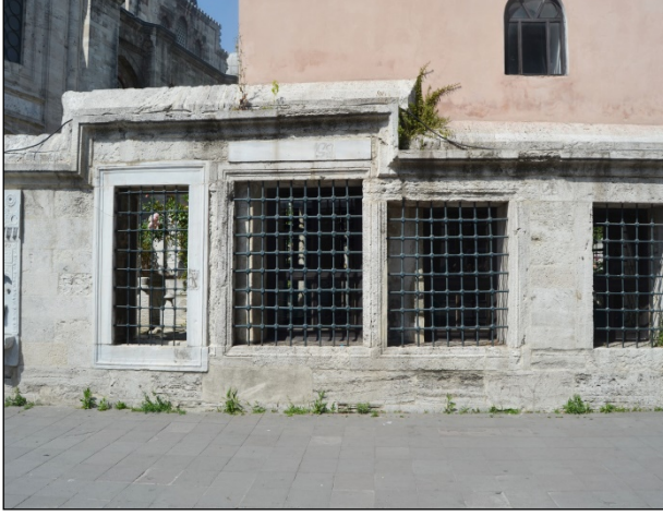
Foto. 9: İstanbul, Hatice Sultan Türbesi, İhata Duvarındaki Pencereleler