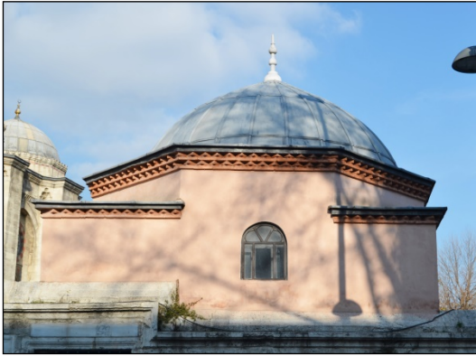
Foto. 13: İstanbul, Hatice Sultan Türbesi, Farklı Genişlikteki Tromp Çikintıları