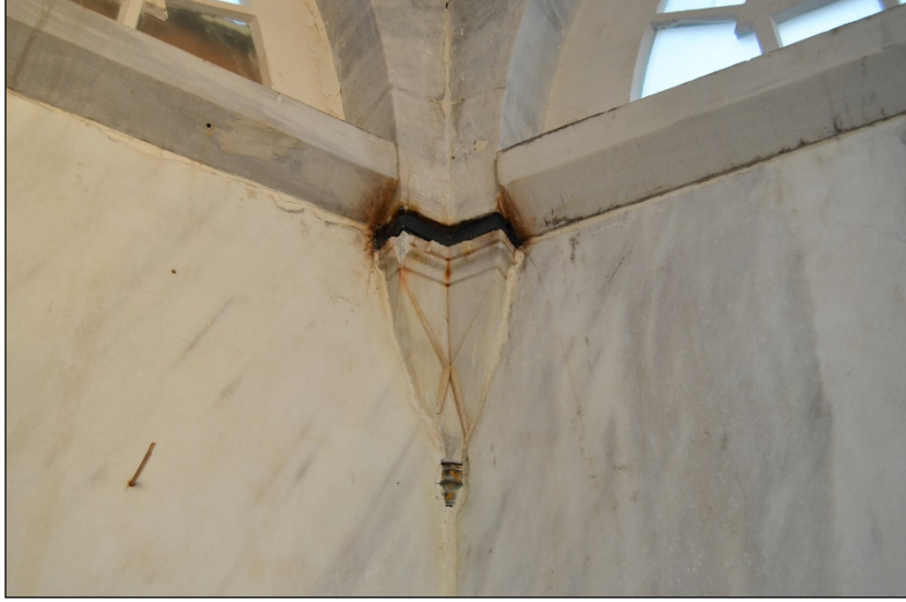
Foto. 15: İstanbul, Şehzade Mahmud Türbesi, Sonradan Kapatılan Açıklıkların İçten Görünüşü