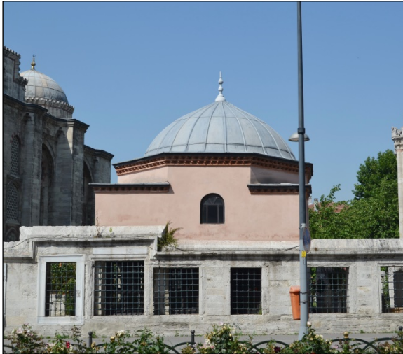
Foto. 7: İstanbul, Hatice Sultan Türbesi, Batıda İhata Duvarı Üzerinde Yükselen Gövde