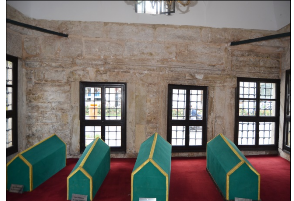
Foto. 14: İstanbul, Hatice Sultan Türbesi, Değişik Boyutlardaki Pencereleler