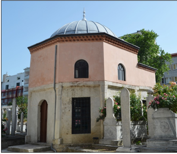
Foto. 5: İstanbul, Hatice Sultan Türbesi, Köşelerdeki Satırlı Taş Direkler