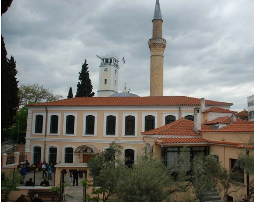
Foto. 26: 1902 – 1903 yılları sonrasında yapılan eklemelerle caminin aldığı görünüm

güneydeki abdest musluklarının yer aldığı düz damlı dikdörtgen bir yapı ve üzerinde sonradan konulan, iki sıra altı satırlık bir çeşme kitabesi vardır. Aşağıda resmi bulunan kitabesinden de anlaşılacağı gibi çeşme, H. 1226 / M. 1811 tarihinde Hacı Mehmet Efendi tarafından cami için yaptırmış, fakat bugün yok edilmiştir.