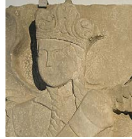
Foto.18: Konya Kalesi'nden üç dilimli taçlı melek figürlü taş kabartmadan detay, 13. yüzyıl (İnce Minareli Medrese Müzesi, Konya)