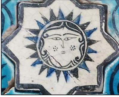
Foto.13: Kubadabad Sarayı çinisinde insan yüzü güneş, 13. yüzyıl (İnce Minareli Medrese Müzesi, Konya)