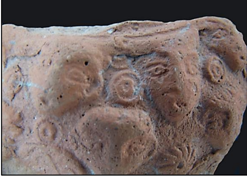
Foto. 11: Ayasuluk insan masklı sırsız-kabartmalı testi parçasından detay, 14. Yüzyıl