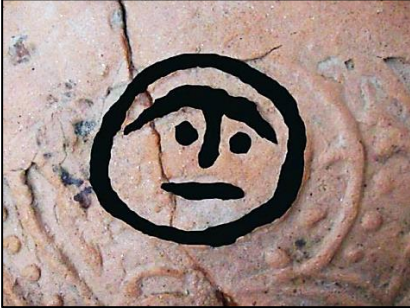
Foto.15: Ayasuluk benek formu ışınlarla çevrelenmiş insan yüzü güneş (figür siyahla belirginleştirilmiştir) betimli sırsız-kabartmalı testi parçasından detay, 14. Yüzyıl