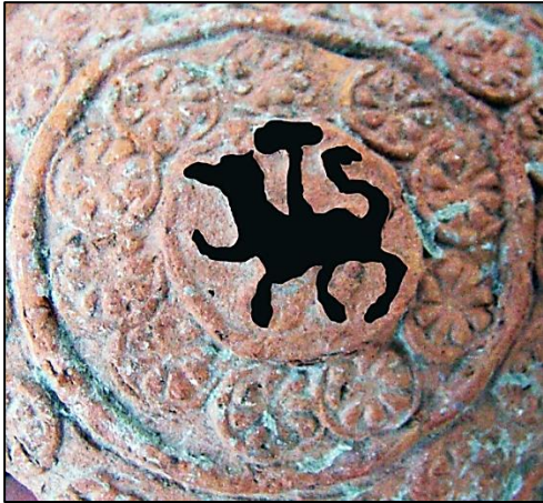
Foto. 9: Ayasuluk yarım palmet kanatlı aslan (figür siyahla belirginleştirilmiştir) betimli sırsız-kabartmalı testi parçasından detay, 14. yüzyıl