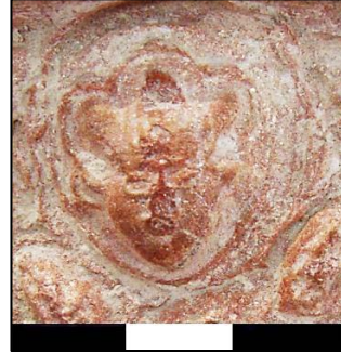
Foto.16: Ayasuluk buluntusu Artuklu küpünden üç dilimli taçlı insan yüzü detayı, 13. yüzyıl