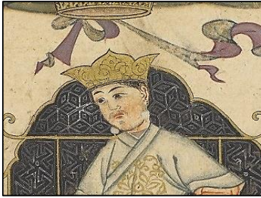
Foto.17: Cami-üt-Tevarih'teki Sultan Berk-Yaruk bin Melikşah portresinden detay, 14. yüzyıl (Edinburgh Üniversitesi Kütüphanesi)