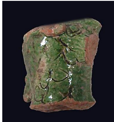
Foto. 4: Aziz Yuhanna Kilisesi GDA 2012 kazısı (APE6.2, +40.87 m / Müze ETD. 12/20), monokrom sgraffito tekniğinde kartal heykelciği başı, 14. yüzyıl