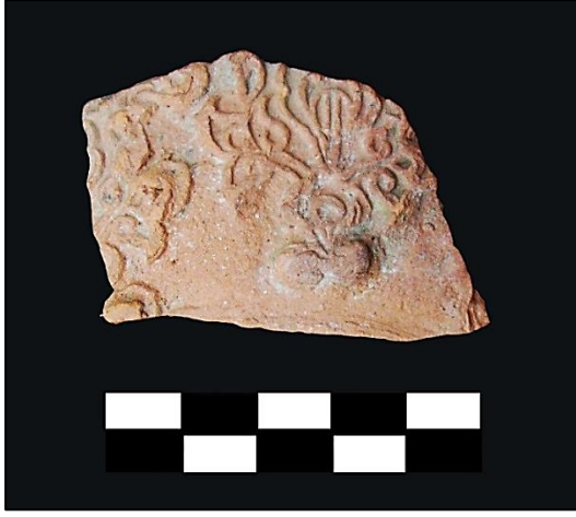
Foto. 5: Ayasuluk hayat ağacı betimli sırsız-kabartmalı testi parçası, 14. yüzyıl