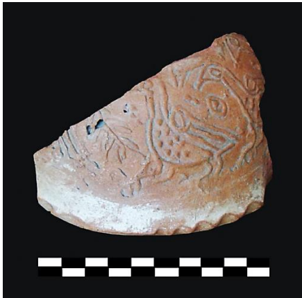
Foto. 3: Ayasuluk kabartma kuş figürlü sırsız-kabartmalı testi parçası, 14. yüzyıl