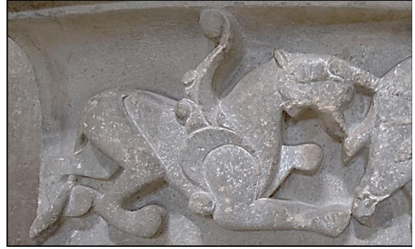
Foto. 8: Konya Kalesi'nden kanatlı aslan figürlü taş kabartmadan detay, 13. Yüzyıl (İnce Minareli Medrese Müzesi, Konya)