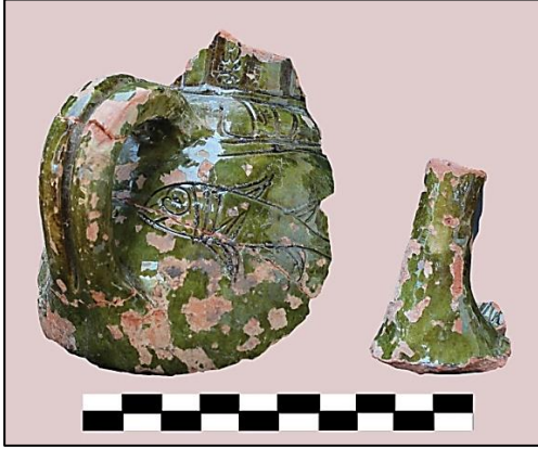
Foto. 2: Aziz Yuhanna Kilisesi Atrium alt yapısı kazısı (1984), monokrom sgraffito tekniğinde balık figürlü ibrik parçası, 15. Yüzyıl