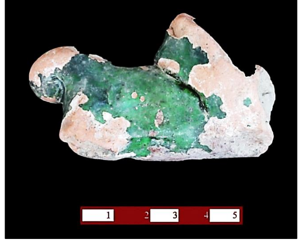
Foto. 6: Ayasuluk pişmiş toprak kanatlı aslan heykelciği parçası, 14. Yüzyıl