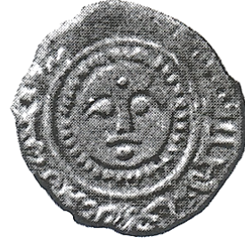
Foto.14: Artuklu II. Necmeddin İlgazi sikkesinde, benek formu ışınlarla çevrelenmiş insan yüzü güneş betimi, 1298