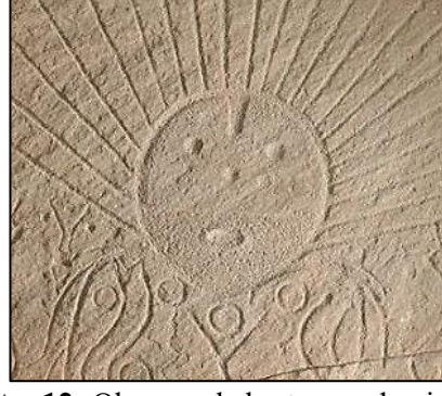
Foto. 12: Okunyeve kabartmasından insan yüzü güneş, M.Ö. 2. binyıl (Hakasya Milli Müzesi)