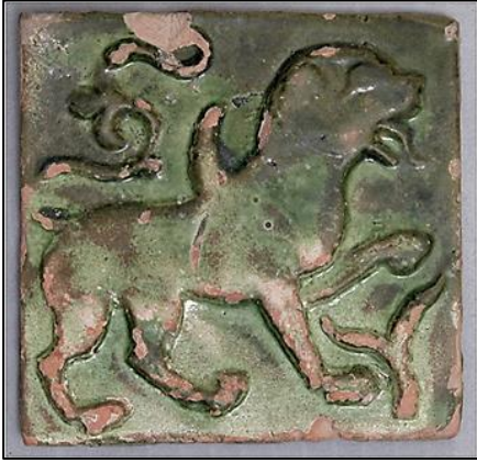
Foto. 7: Gazne Sultan III. Mesud Sarayından kabartma kanatlı aslan figürlü çini, 13. yüzyıl (Metropolitan Museum of Art, New York).