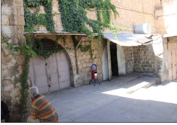
Foto. 11: Bakircilar Çarşısı Önünde Daha Önce Revak Bulunan Dükkânlar