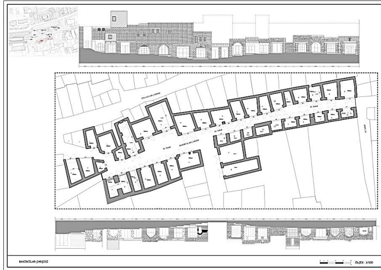
Çizim 3: Mardin Bakırcılar Çarşısı Planı ve Görünüşleri