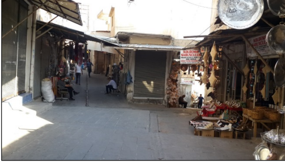
Foto. 1: Tellallar Çarşısı ile Bakircılar Çarşısının Başladığı Sokak