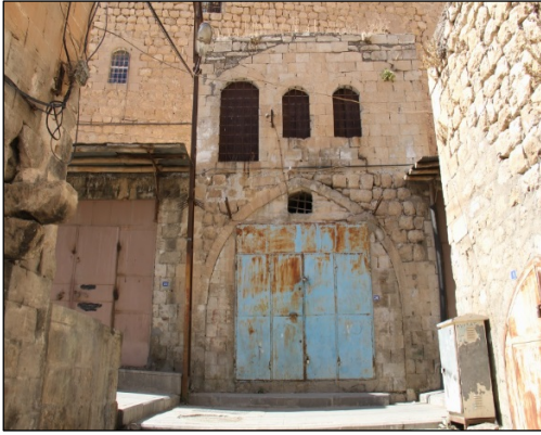
Foto. 9: Bakırcılar Çarşısı Üst Katı Konut Olan Dükkânlardan Örnek