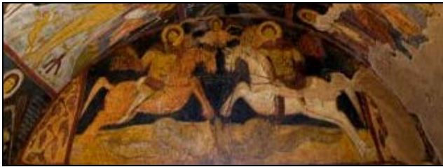
Foto. 4: Gülşehir, Vaftizci Yahya Kilisesi'nde tonoz alnlığında, Gregorios ve Theodoros (Sol)