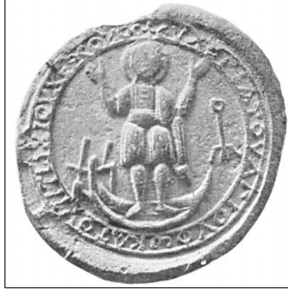
Foto. 1: Hermitage Müzesi, Kil Eser, Hagios Phokas Tasviri (Vikan, Fig. 6)