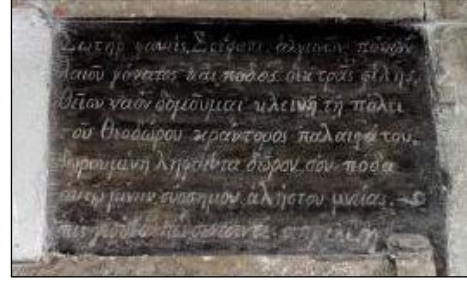
Foto. 2: Kuzeydeki Kitabe (Büyük Harfli), Güneydeki Kitabe (Küçük Harfli)